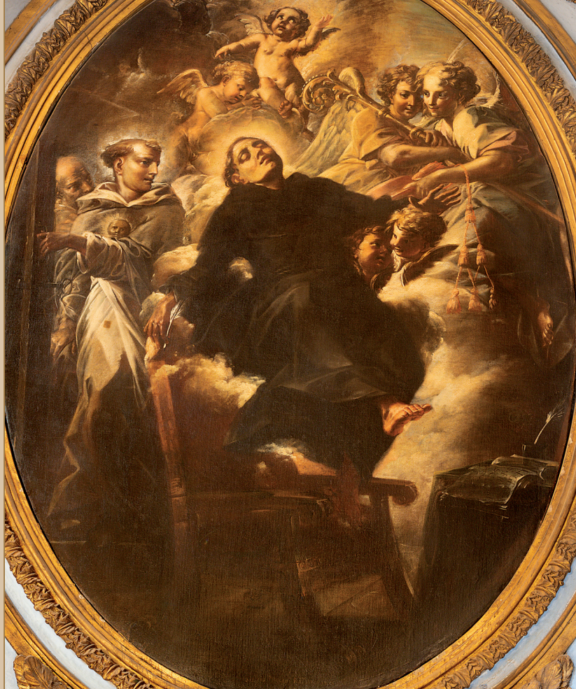
Biagio Puccini, Św. Bonawentura w ekstazie (1708). Rzym, kościół św. Pawła na Regoli

slijediti nauk i stope Gospodina našega Isusa Krista“ ( NPr , I, 1), onoga koji je postao utjelovljena Riječ i bio raspet.